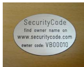
Voorbeeld Oval Standard

Uitermate geschikt voor laptops en alle andere dure hardware waar voldoende ruimte is voor deze 60 x 40 mm. plaquettes. Andere maten en vormen zijn op aanvraag mogelijk. Indien u de gewenste tekst en cijfers opgeeft maken wij een voorbeeld ter accordering of ter wijziging. Ook logo's zijn mogelijk.